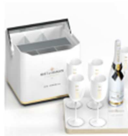
PLV Moët – Ice Cooler Imperial