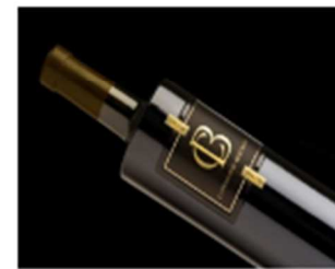
Etiquette « Seridôme », un brevet mondial