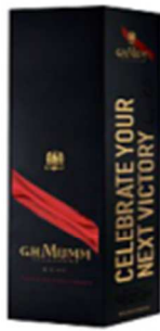
Coffret série limitée MUMM – Grand Cordon