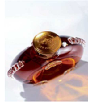
Smart Decanter Louis XIII – La toute première carafe connectée