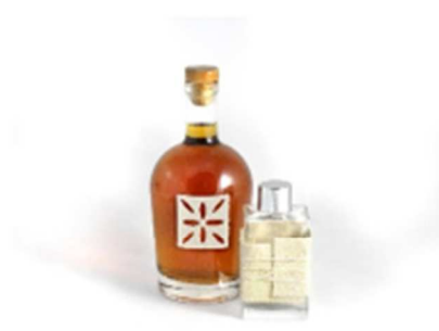
Décor de bouteille en Pinatex