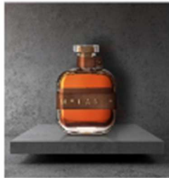
Mélanie, une bouteille élégante et sophistiquée pour tous les spiritueux